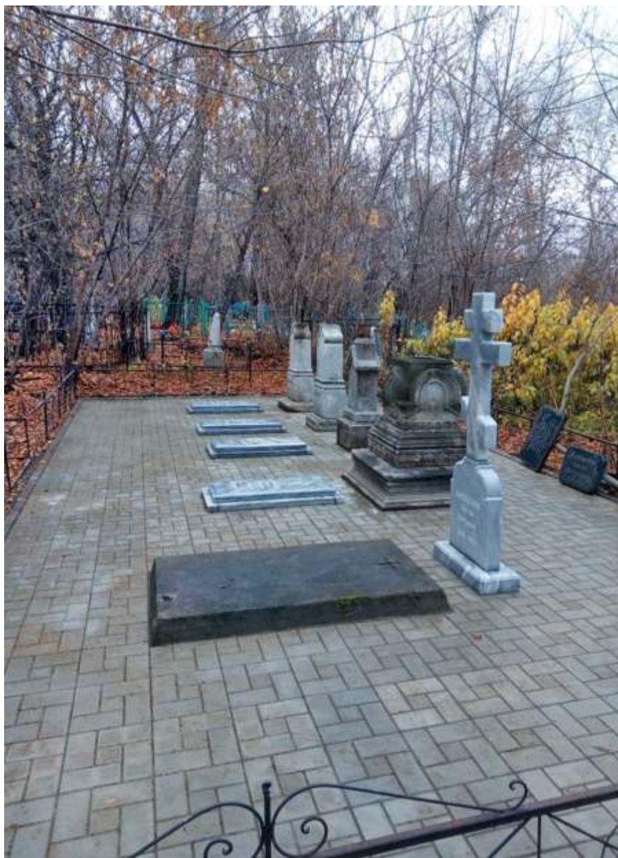
Отреставрированное мемориальное захоронение Копыловых на Воскресенском кладбище, октябрь 2019 г.