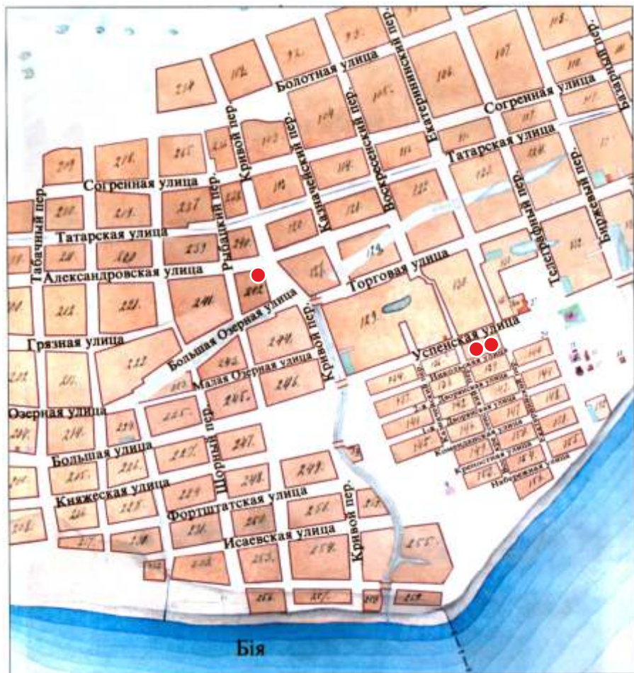
Фрагмент плана Бийска, 1886 г.