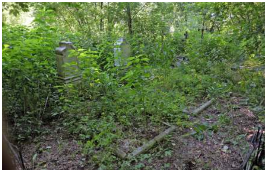
В таком виде находилось мемориальное захоронение Копыловых летом 2019 г.