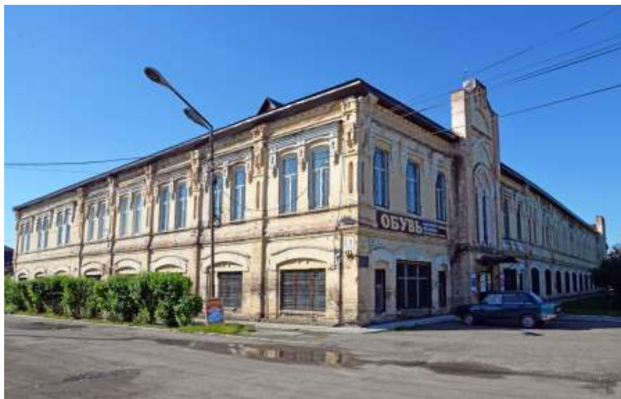
Основной вклад сделал А. П. Копылов в строительство вольного пожарного общества в г. Бийске. Теперь здесь находится Бийская обувная фабрика.